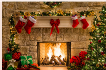
Typické americké vánoční krby

24. prosince se slaví Vánoce v Americe jinak než u nás v Česku. Podává se sváteční večeře v podobě krocana, opět se šouchanými bramborami a brusinkovou omáčkou anebo krocana plněný cibulí a celerem. Dárky se dávají až na Boží hod - ráno po našem