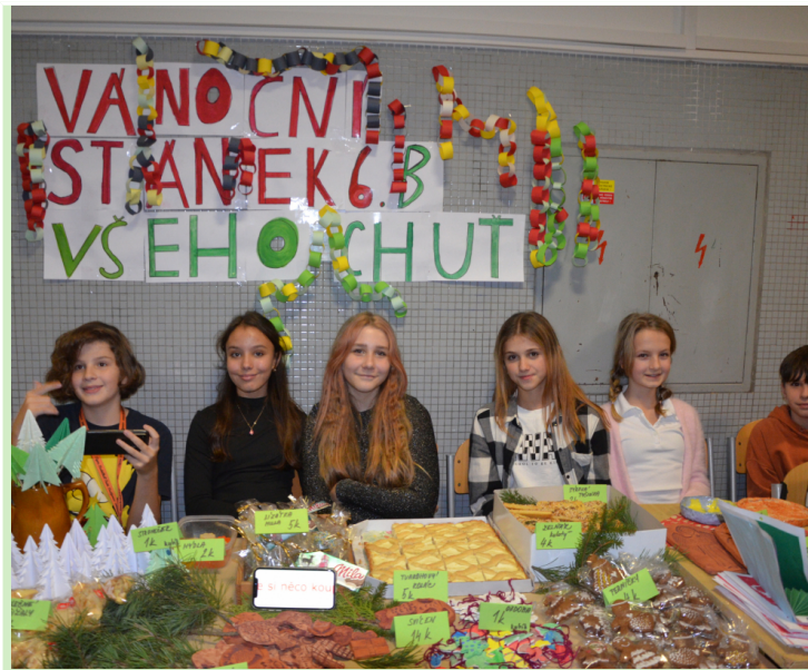
vánoční výrobky a dekorace.