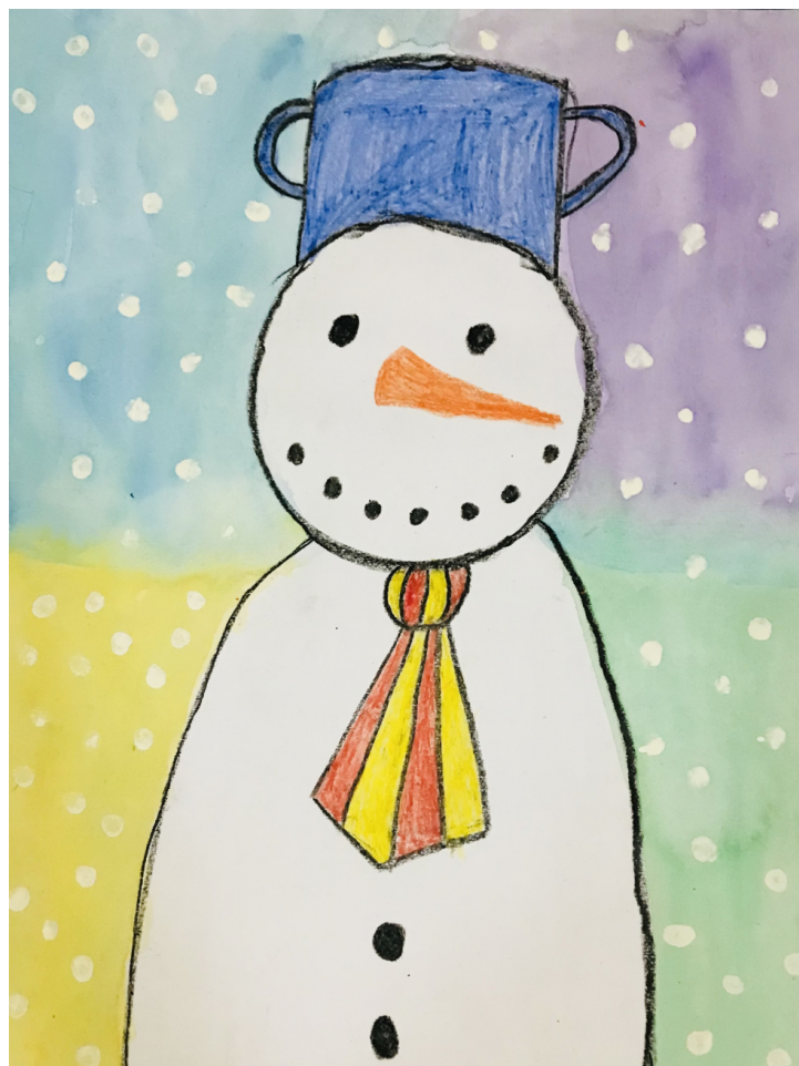
ilustrace: 3. třída