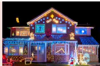
Názorná ukázka domů v Americe o Vánocích

Vánoční stromky se u nich zdobí již na Den děkování.