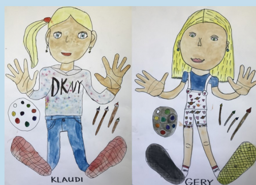
ilustrace: 2. třída