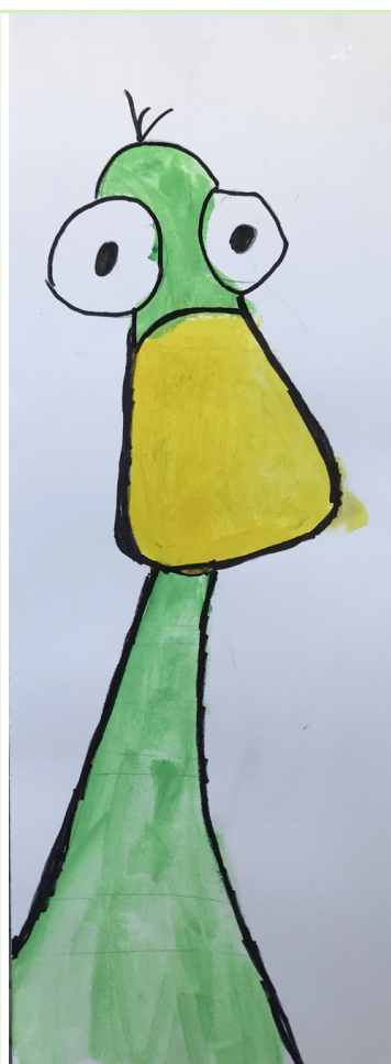
ilustrace: 3. třída