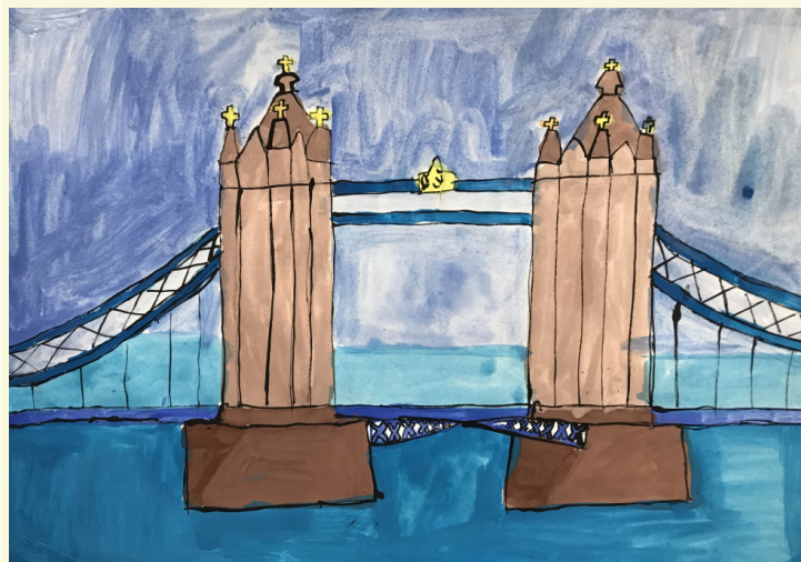
ilustrace: 5. třída