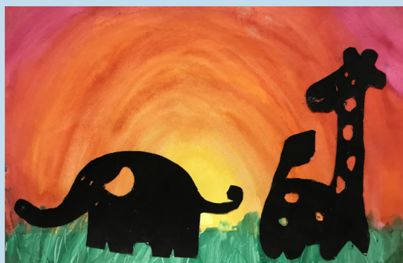
ilustrace: 1. třída