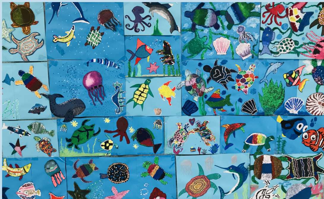
ilustrace: 7. třída

Školní rok utekl jako voda a před námi jsou letní prázdniny. Všichni už máme plnou hlavu léta, a proto je toto číslo věnované cestování, letním akcím a také angličtině, kterou na svých cestách do zahraničí určitě využijete. Přečtete si, kam vyrazit v Čechách, jaká jsou hezká místa v Itálii a Řecku, poznejte