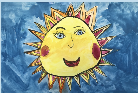
ilustrace: 3. třída