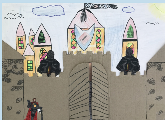
ilustrace: 4. třída